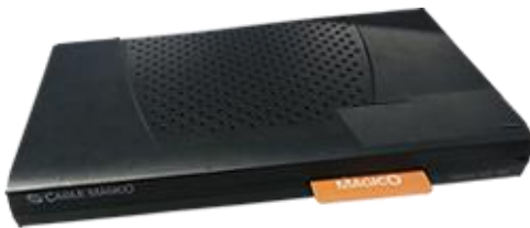
KATHREIN S271 (P)

Recuerda que estos son los decodificadores que tenemos como parte del servicio satelital.